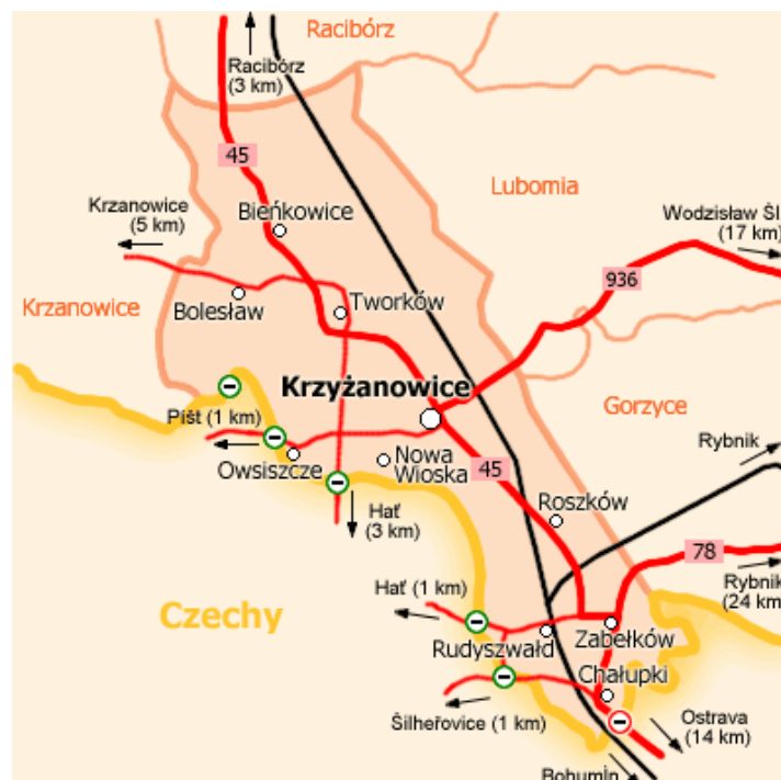
Rysunek - Układ sieci dróg i linii kolejowych na terenie Gminy Krzyżanowice

Szczegółowe zestawienie dróg powiatowych i gminnych, a także linii kolejowych przedstawiono na mapce poglądowej.