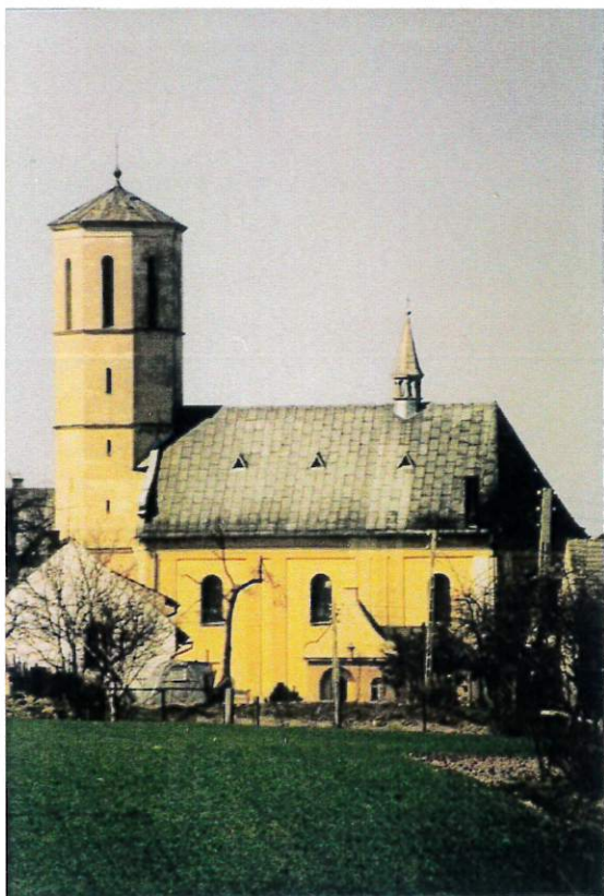
Fot.1 – Widok ogólny przed remontem wieży