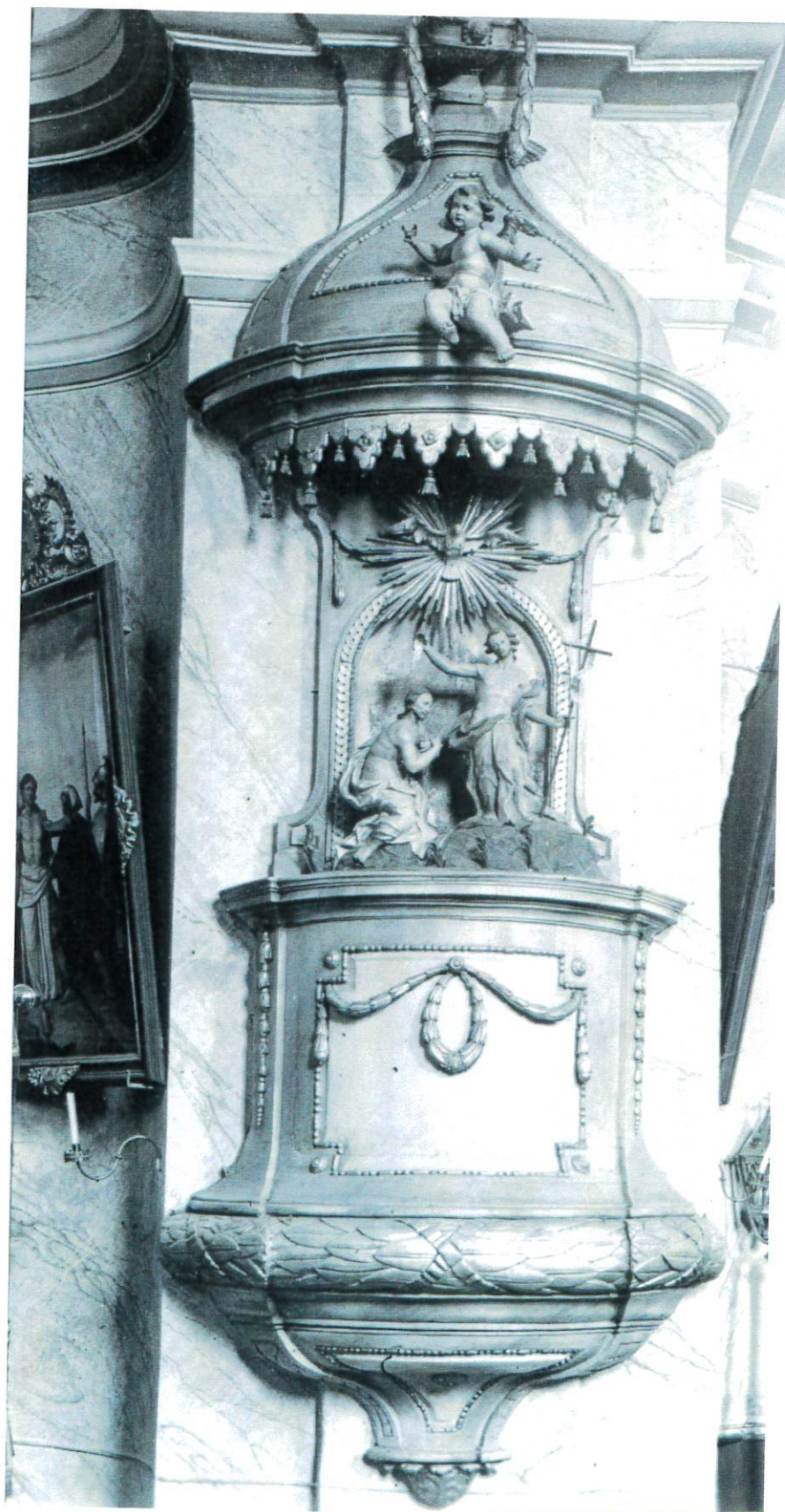
Fot. 4 – Zdjęcie archiwalne – widok ogólny