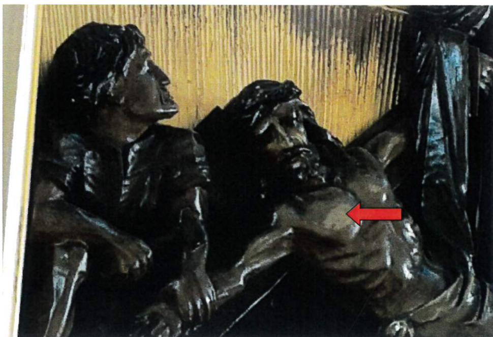
Fot. 6 – Przyciemniała polichromia

Drewniane obramienia noszą ślady drewnojadów. Połączane szlagmetalem tło płaskorzeźby zostało w latach 90 zrekonstruowane podczas ostatniej renowacji, ponieważ struktura drewna była silnie naruszona przez drewnojady. Polichromia płaskorzeźby mocno pociemniała, miejscami widoczne jaśniejsze odcienie kolorów pomimo zabrudzeń (fot. 6) – prawdopodobnie pokryta lakierem lub innym środkiem, który przyczynił się na przestrzeni czasu do ściemnienia oraz żółknięcia powierzchni.