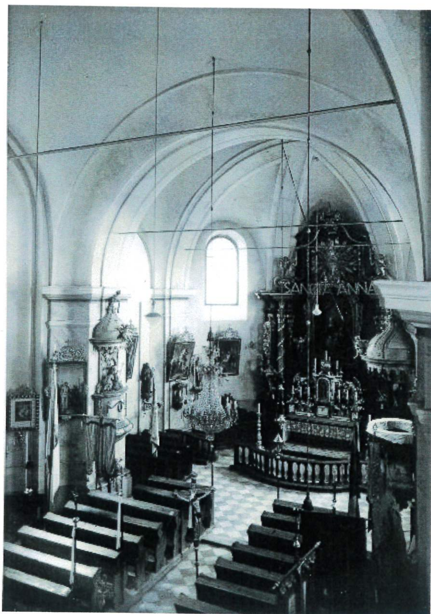
Fot. 3 – Zdjęcie archiwalne – widok ogólny