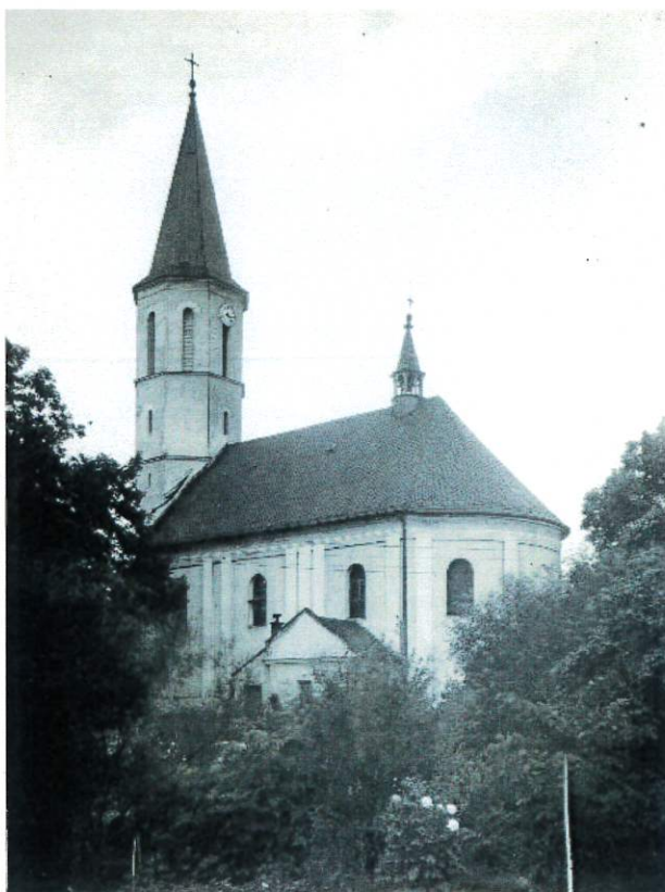
Fot. 2 – Widok ogólny przed 1939 rokiem