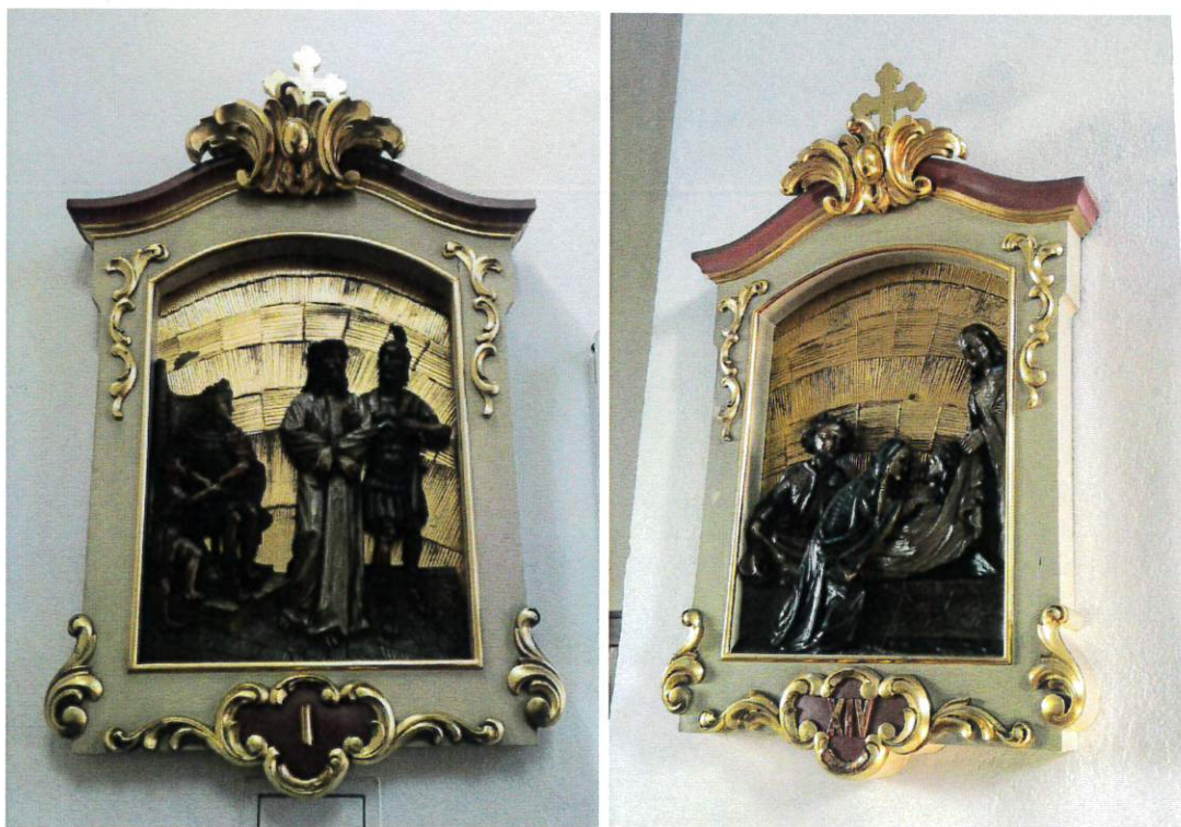
Fot 4, 5 – Aktualne zdjęcia stacji drogi krzyżowej