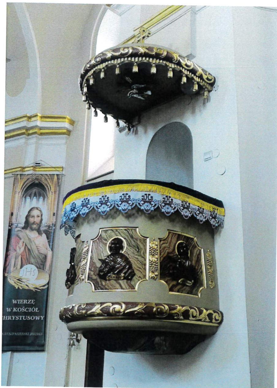
Fot. 5 – Ambona obecnie