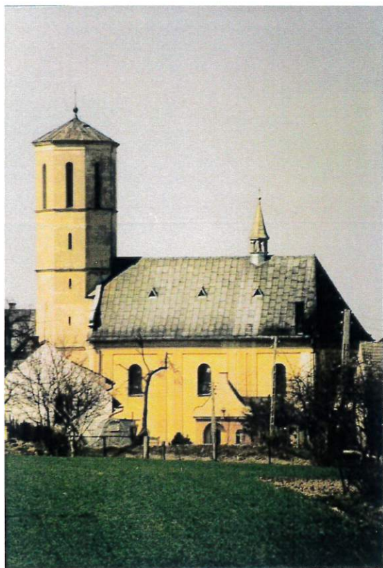
Fot.1 – Widok ogólny przed remontem